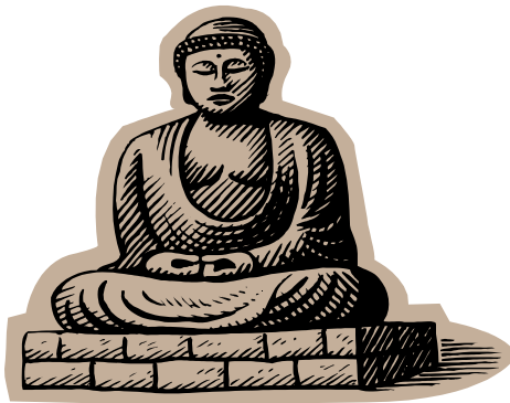
Statua raffigurante il Buddha

A riguardo, va sottolineata una singolare e paradossale coincidenza rispetto ad una seppur vaga affinità concettuale globale, sul versante della percezione del " tempo " come nozione di un " divenire " ciclico infinito ed inesauribile, tra due delle più irriducibili e antitetiche visioni del mondo e dell'esistenza, da un lato la teoria ateo-materialistica del filosofo di Efeso, dall'altro una delle dottrine di maggiore ispirazione mistico-spirituale in senso assoluto che la storia del pensiero umano abbia mai conosciuto.