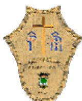
MISERICORDIA DI PATERNOPOLI