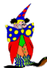
Associazione Cultura "Lo Zèrre"