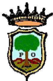
COMUNE DI PATERNOPOLI