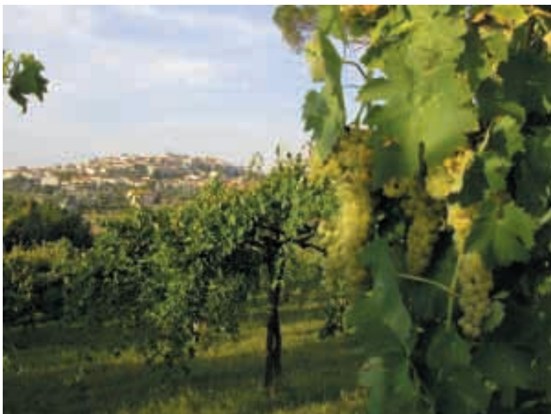
Paternopoli, panorama.