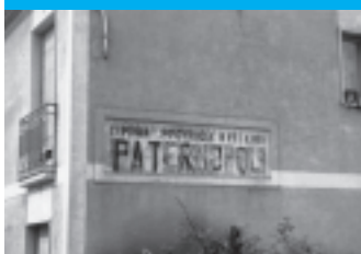
Ingresso a Paternopoli (1977)

Tutti pronti quindi per la dar vita alla squadra ufficiale del "Mazza e Piezo" (gioco di riferimento del torneo), allenarsi e rendere la vita difficile alle squadre che parteciperanno al relativo Torneo Regionale del prossimo anno.