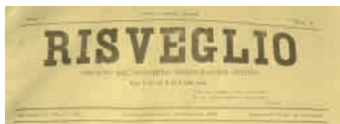
Testata originale del 1908

"Risveglio" vuole essere anche uno strumento attraverso il quale gli emigrati possono sentirsi vivi alla loro terra di origine e, perché no, uno strumento per far conoscere i nostri ottimi prodotti.