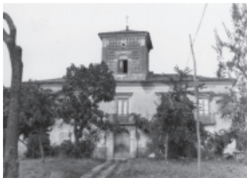
Villa Modestino - San Nicola (1977)

Le voglio rice: nenna, bella mia, le voglio rice: nenna, bella mia, si Dio c'è destinato, oi ni, nenna, si Dio c'è destinato tu non puoi mancà. composto da una parte ritmica molto accentuata e di un testo di due strofe semplici e ripetitive. Termina così la lunga giornata di lavoro e di festa, di spensieratez-