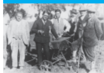
Signorotti di un passato ormai lontano